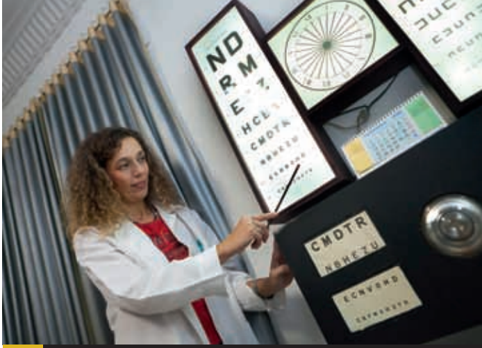
1 El facultativo del centro comprueba la agudeza visual del conductor. Si existe algún problema, un oftalmólogo deberá realizarle un examen en profundidad.