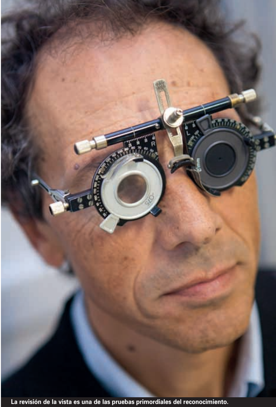
La revisión de la vista es una de las pruebas primordiales del reconocimiento.

LOS CONDUCTORES DEBEN EXIGIR QUE LES HAGAN UNA REVISIÓN MÉDICA PSICO-FÍSICA