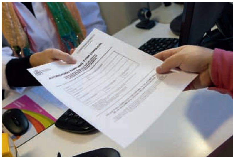
8 Si el resultado del reconocimiento es Apto, algunos centros ofrecen la posibilidad de tramitarle el permiso por vía telemática sin tener que pasar por la Jefatura.