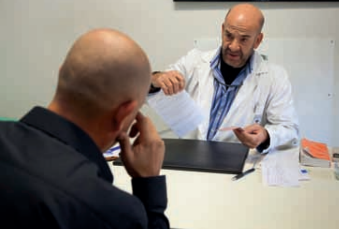
3 El médico deberá preguntarle si padece alguna enfermedad o está sometido a algún tratamiento, si le cuesta dormir o tiene alguna adicción.