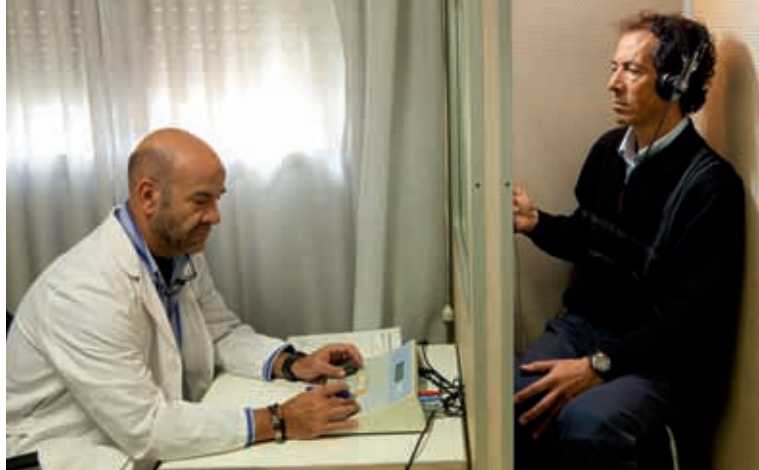
4 Se deberá comprobar también si la capacidad auditiva del conductor es adecuada. A partir de una pérdida auditiva del 45% hay que colocar adaptaciones al vehículo.

revisión, el médico deberá comprobar la agudeza visual, la reacción al deslumbramiento, la existencia de cataratas o de problemas de motilidad ocular.