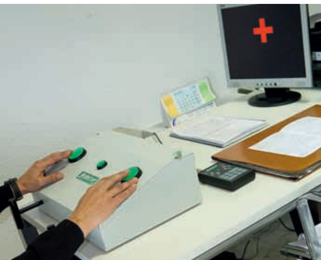
7 Los conductores profesionales son sometidos a una prueba adicional de coordinación de pies y manos llamada “Reacciones múltiples”.

La mayoría de los 2.000 CRC que existen en España, a plaude las medidas anunciadas por el fiscal de Seguridad Vial de perseguir, y castigar con penas de hasta tres años de cárcel, las irregularidades más graves cometidas por los centros. Los que cumplen, están totalmente de acuerdo. ♦