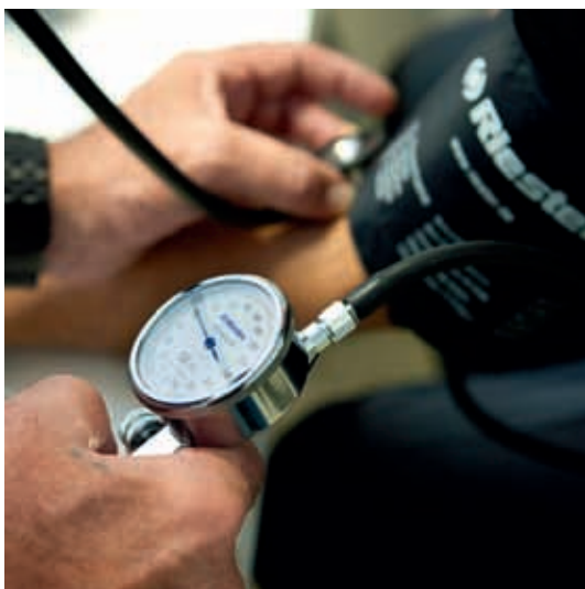
5 El facultativo ausculta y toma la tensión al conductor, que es responsable de la información que facilita al centro.